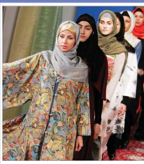
بحث لباس های متحدالشکل دانشجویی هم چند ماه گذشته در وزارت علوم هم به گوش رسید که البته آن زمان وزارت علوم به این پیشنهاد واکنش نشان داد و مدیرکل اداره امور فرهنگی وزارت علوم با بیان اینکه این وزارتخانه همه دنبال یکسان سازی پوشش دانشجویی نیست «آن را تکلیب کرد پوشش زنان شاغل در ادارات دولتی تا بیش از این نیز کم و بیش یکسان بوده است. پوشش ویژه زنان در محیط های اداری، به طور معمول شامل مانتو و شالوار و مقنعه بوده است اما به آنها اجازه داده می شد که از بین رنگهای پذیرفته شده که اغلب رنگهای سرمه ای، مشکی، طوسی و قهوه ای استفاده کنند.