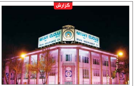
مدیر بیمه ایران استان اصفهان:

فرش و موکت ماشینی در نمایشگاه گسترده می شود سومین نمایشگاه تخصصی فرش ماشینی موکت و کفپوش اصفهان همزمان با نهمین نمایشگاه تخصصی صنایع غذایی، صنایع پوشاک و خدمات وابسته، چهارم اسفندماه گشایش می یابد. سومین نمایشگاه تخصصی فرش ماشینی، موکت و کفپوش در دو سال و فضای بالغ بر پنج هزار و ۵۰۰ مترمربع برپا می شود. این نمایشگاه ۲۳ شرکت از استانهای اصفهان، تهران، اردبیل و مازندران از کشورهای ترکیه، کره، چین و بلژیک تولیدات خود را به نمایش خواهند گذاشت. همچنین نمایشگاه صنایع غذایی با ۶۰ شرکت کننده از استان های اصفهان، تهران، خراسان رضوی، چهارمحال و بختیاری و سیستان و بلوچستان نمایشگاه برپا خواهد شد. صنایع چاپ و بسته بندی محصولات، انواع محصولات غذایی، تولید انواع کنسروهای گوشتی و گیاهی، فرآوری و بسته بندی سبزیجات، تولید انواع روغن های خوراکی نباتی، فست قودها، غذاهای آماده و نیمه آماده، پختناله ها، کارخانجات تولیدی قند و شکر، تهیه تزیین و بسته بندی زعفران، انواع مواد پودری و استازرژهای لبنی از جمله زمینه های حاضر در این نمایشگاه است. این دو نمایشگاه از تاریخ چهارم تا هفتم اسفند ماه در محل نمایشگاه های بین المللی استان اصفهان در کنار بل تاریخی شهرستان از ساعت ۱۰ تا ۲۱ برای بازدید علاقه مندان دایر خواهد بود.